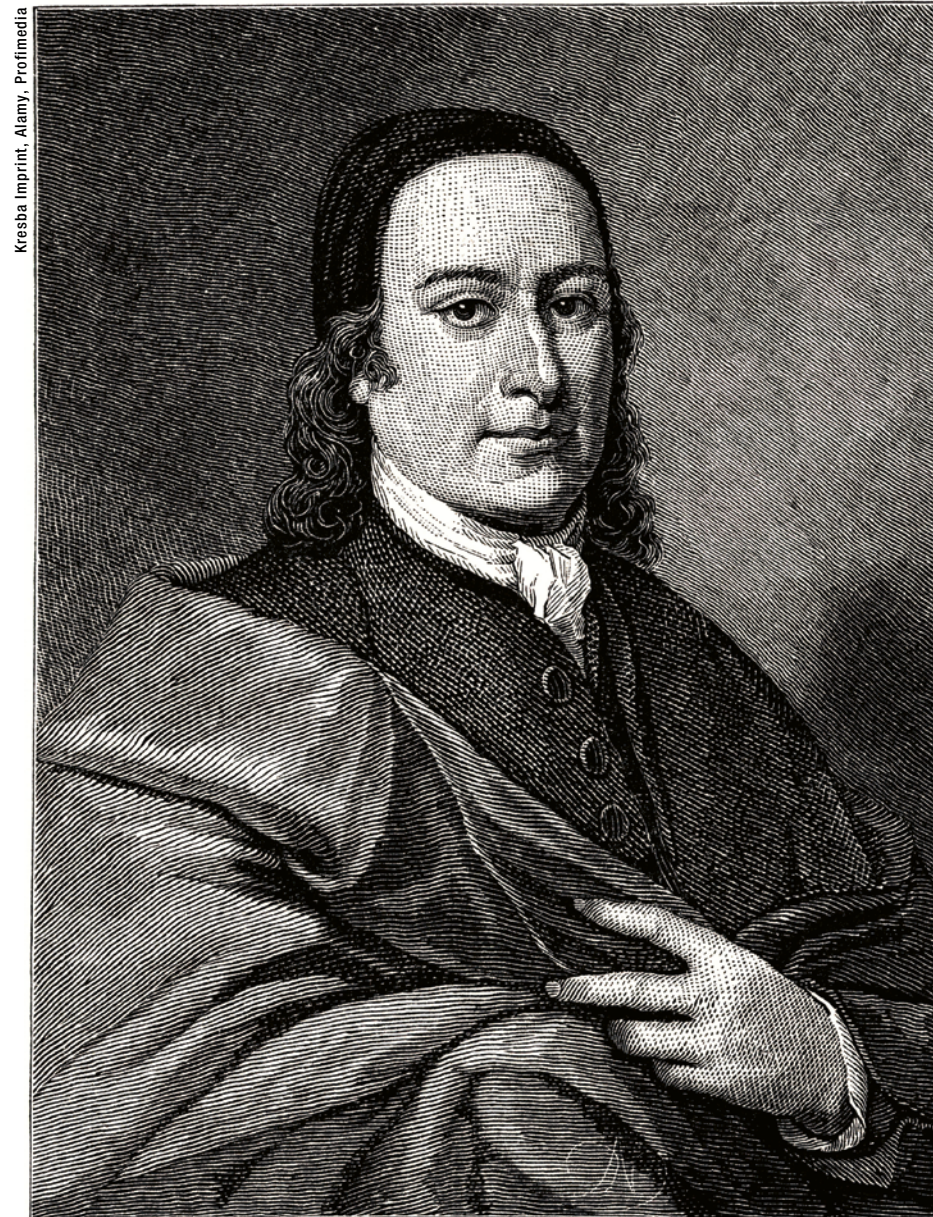
1. HRABĚ Mikuláš Ludvík Zinzendorf

Zdeněk Lyčka na základě příspěvku Hany Kyselé ve Sborníku ze IV. konference MORAVIANU 2006