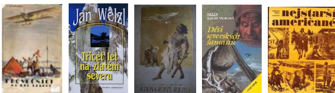
Obr. 3.3.2-3 Trosečníci na kře ledové