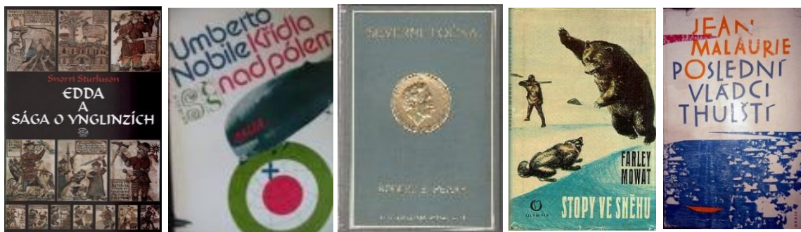
Obr. 3.3.2-13 Edda a Sága o Ynglinzích

Nejvíce „arktických“ překladů je z angličtiny, podařilo se mi dohledat desítky titulů. Překlad Pearyho Severní Točny (1913) (Obr. 3.3.2-15) vyšel tři roky po vydání originálu. Po roce 1989 jsou vydavatelsky aktivní zejména BB Art ( Frigidní ženy , Terror , Ledový ostrov ), Paseka ( Ztroskotání na pólu ), Domino ( Arktická mise ) a INA ( Objevování polárních krajů ), ale též Knižní klub ( Cesta sněžných ptáků ), Vladislav Pavelek ( Arktický bush pilot ) a mnoho dalších nakladatelství. V roce 2010 vyšel český překlad Mikea Horna Pokořil jsem ledové království .