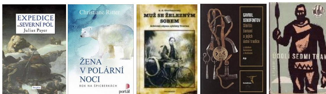
Obr. 3.3.2-18 Expedice na severní pól

Pokud jde o překlady z němčiny, je nutno zmínit zejména popis expedice Julia von Payera z let 1872–1874 v překladu Jaroslava Hoška, který vyšel téměř po sto letech pod titulem V ledovém zajetí (1969). Reedice Hoškova překladu vyšla v roce 2019 v nakladatelství Dauphin pod názvem Expedice na severní pól (Obr. 3.3.2-18). Německý bestseller výše uvedené Christiane Ritterové se objevil v českém překladu v roce 2020 pod názvem Žena v polární noci s výstižným podtitulem Rok na Špicberkách (Obr. 3.3.2-19). Ze starších titulů německy píšících autorů stojí za zmínku Země na obzoru , Lod' do Grónska a životopis Knuda Rasmussena.